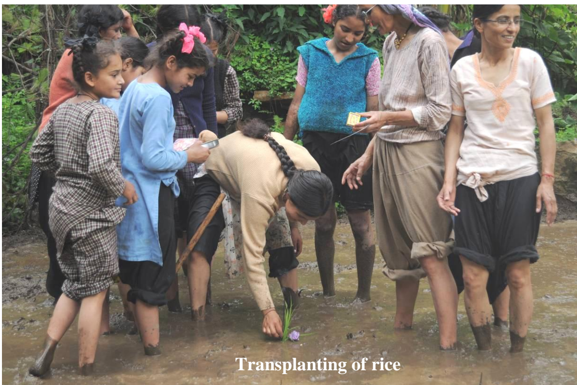
Transplanting of rice

At leve sammen med folkene fra Lakshmi Ashram, som arbejder med al deres tid og energi for at ændre samfundet, og at tilbringe så megen tid med de muntre piger var en inspirerende oplevelse, som jeg vil tage med mig – sammen med mange, mange minder og nye tanker, som vil få dette år i bjergene til at stå lyslevende i mit hjerte.