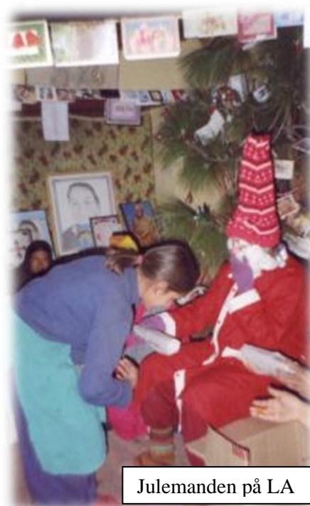
Julemanden på LA

Tak til alle jer, der har sagt ja til denne ordning.