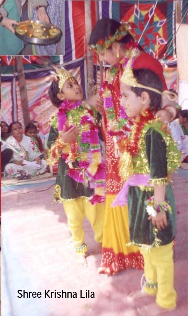
Shree Krishna Lila