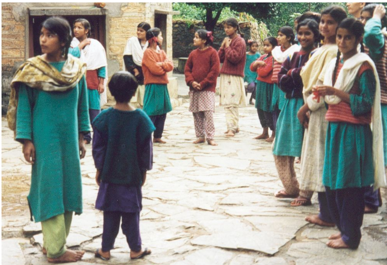
Nogle af pigerne samlet foran The Hostel en tilfældig morgen.

Det blev efterfulgt af andre klasser, der præsenterede deres optræden. En mand fra Gujarat var også til stede, og han opførte en Gujarati folkedans. Da programmet var slut, spiste vi alle frokost sammen. På denne måde fejrede vi Raksha Bandhan festivalen. Fællesskabet omkring Raksha Bandhan i ashrammen har i sig selv en stor betydning.